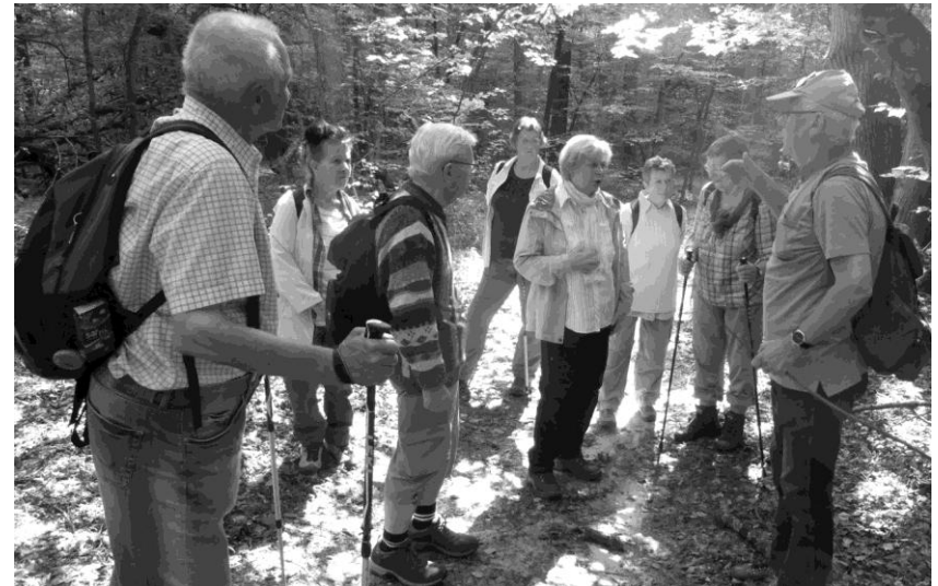
Fachkundig geführte Wanderung im „Colbitzer Lindenwald“

Treffpunkt: * Hörsaal im Haus A (Institut für Anatomie), Liebigstr.13 Wahlversammlung VLW ** Sportforum 2.Etage Raum 2.037