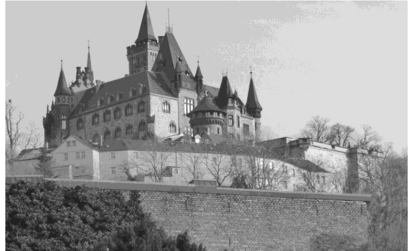
Schloss in Wernigerode