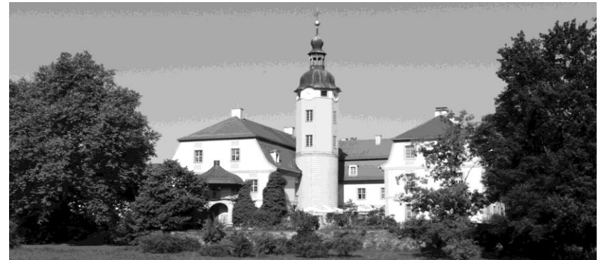
Schloss in Machern