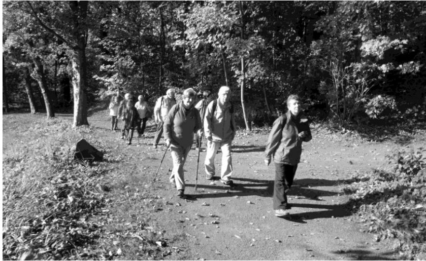
Wanderung von Grimma über die „ Ostwald Gedenkstätte “ nach Großbothen