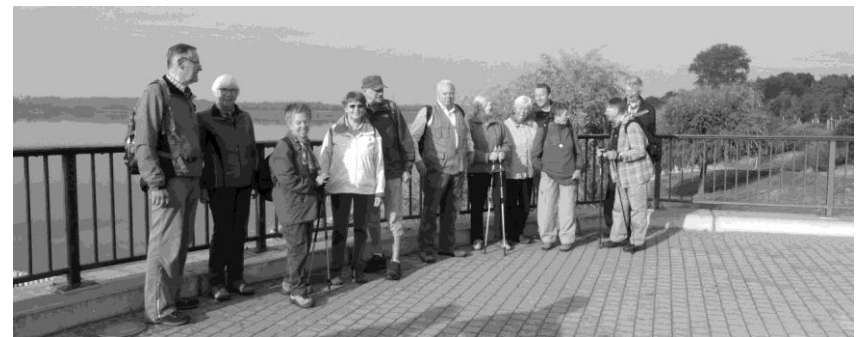
Start am Markkleeberger See